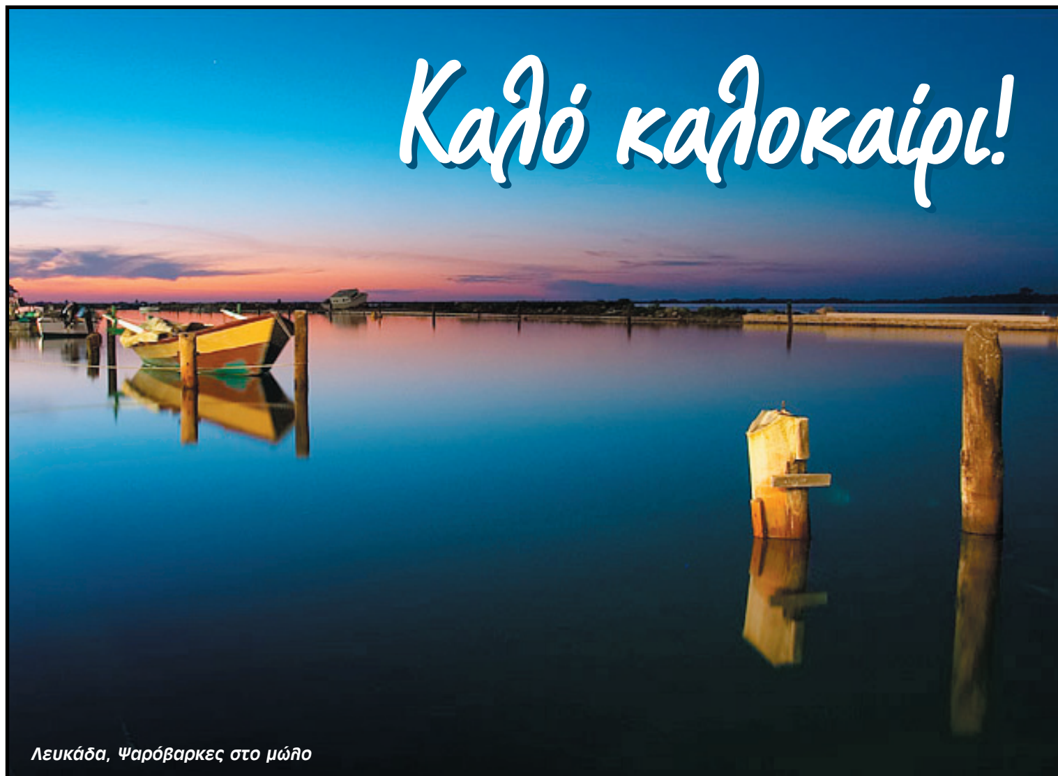
Λευκάδα, Ψαρόβαρκες στο μώλο