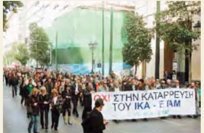
Από τη διαδήλωση της ΠΟΣΕ ΙΚΑ στην Αθήνα στις 29/11.